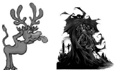
Vignetta satirica di ArtDarkGatt